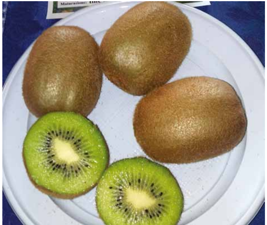
▲ Foto 1 - Frutti di Hayward, la varietà a polpa verde più coltivata.

Al sud un certo interesse nella coltivazione si è avuto in Campania e soprattutto in Calabria, mentre in Basilicata si è avuta una diminuzione della superficie, con un investimento totale di circa 450 ha, ma si è cercato di innovarne la coltivazione con l'introduzione di varietà e nuove tipologie di frutti. La coltivazione in Basilicata di questa specie è avvenuta da circa un trentennio con la tipologia verde, principalmente con la cv. Hayward. La disponibilità idrica di questo territorio ha consentito uno sviluppo per questa specie, anche se l'avvento di altre specie frutticole, come albicocche e pesche-nettarine, ne ha limitato una maggiore diffusione. Un