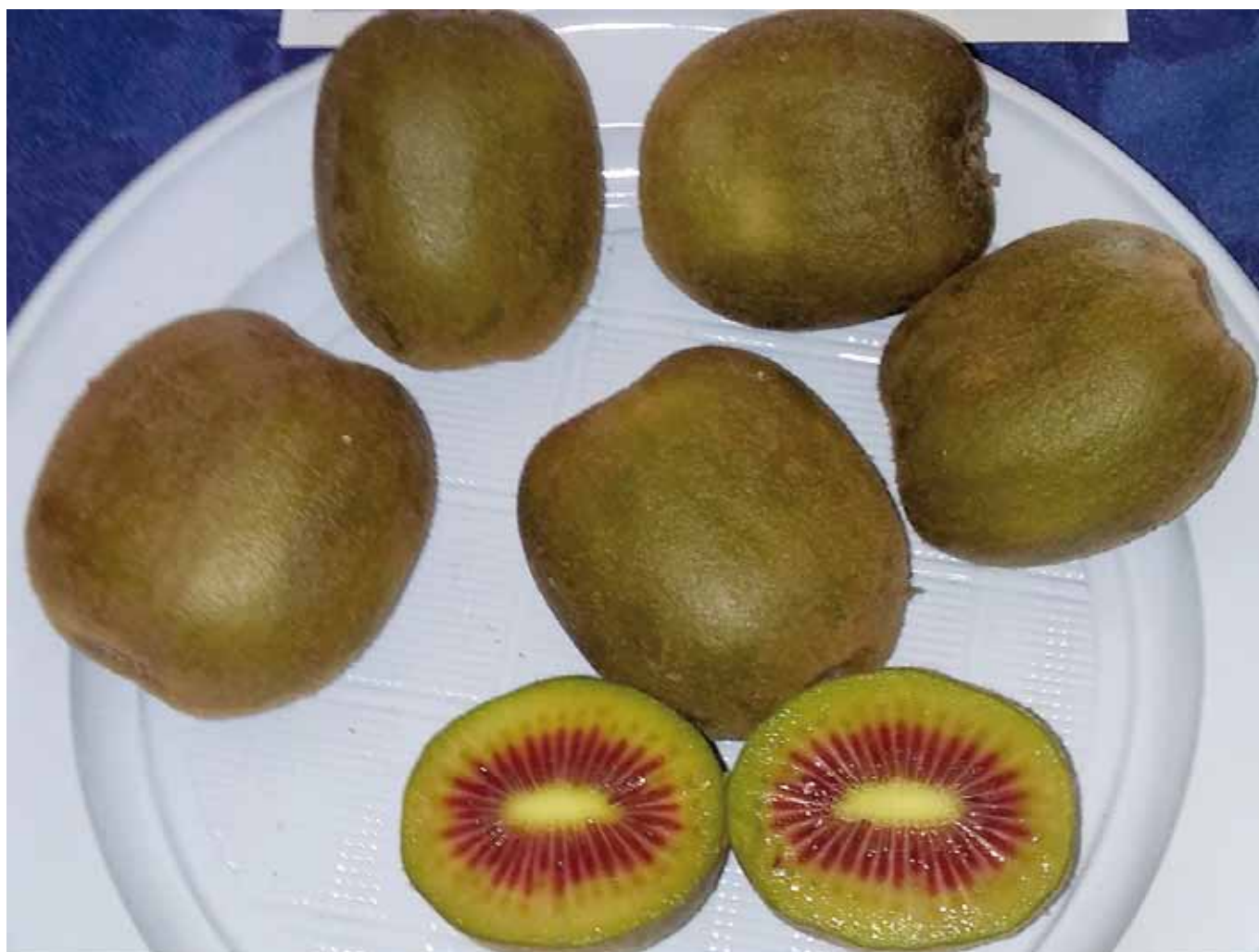
▲ Actinidia al frutto rosso.