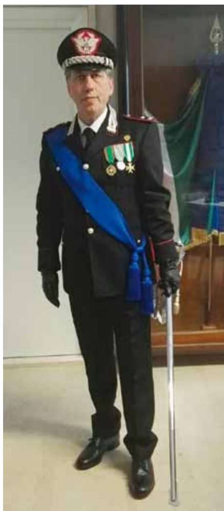
▲ Gen. Giuseppe GIOVE.

ne che per effetto di particolari forme di antropizzazione potevano perdere la stabilità o turbare il regime delle acque ovvero incidere su eventi idrometeorici che avrebbero avuto ripercussioni negative sui fenomeni naturali dei ruscellamenti e dei ristagni superficiali delle acque.