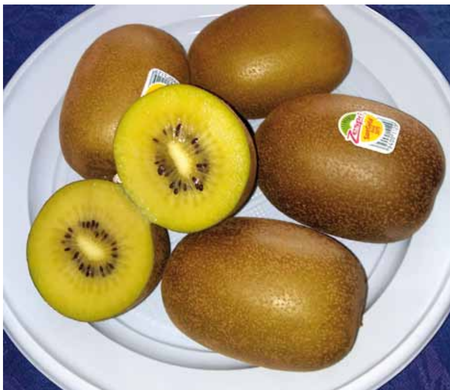
▲ Foto 2 - Frutti di Gold 3, varietà che ha sostituito Hort 16A, nei nuovi campi nel Metapontino.

ta. Questo a testimonianza di una forte innovazione che si ha per questa coltura, che si traduce in nuovi spazi di mercato che la stessa si può ritagliare.